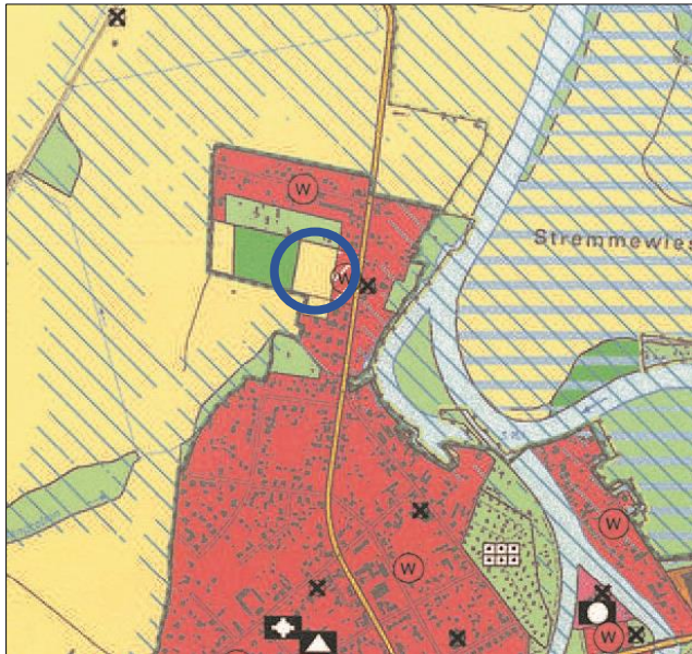
Abbildung 3: Ausschnitt des Flächennutzungsplans der Stadt Rathenow, Grundlage FNP der Stadt Rathenow 09/2017 (ohne Maßstab)

Gemäß § 8 Abs. 2 BauGB sind Bebauungspläne aus dem Flächennutzungsplan zu entwickeln. Gemäß der Regelungen § 13a Abs. 2 Nr. 2 erfolgt eine Berichtigung des Flächennutzungsplans.