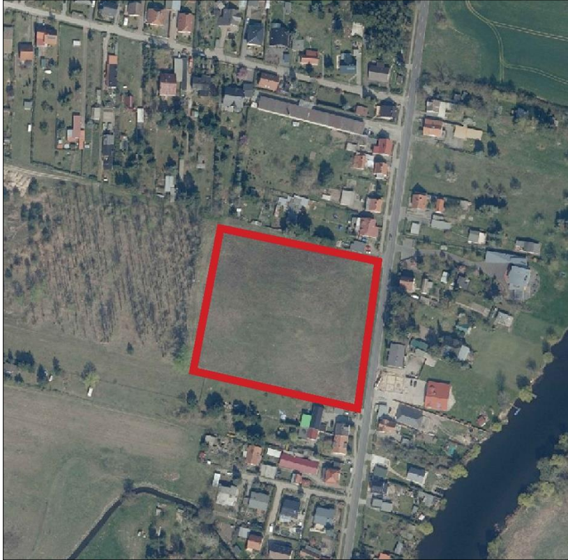
Abbildung 1: Lage des Geltungsbereiches zur bebauten Umgebung. Das nördliche, östliche und südliche Umfeld des Geltungsbereiches ist durch Wohnbebauung geprägt. Das Plangebiet stellt einen Lückenschluss innerhalb des bebauten Siedlungskörpers dar.; Basis Luftbild Brandenburgviewer 11/2021 (ohne Maßstab)

Die Brandenburgische Bauordnung (BbgBO) wird beachtet.