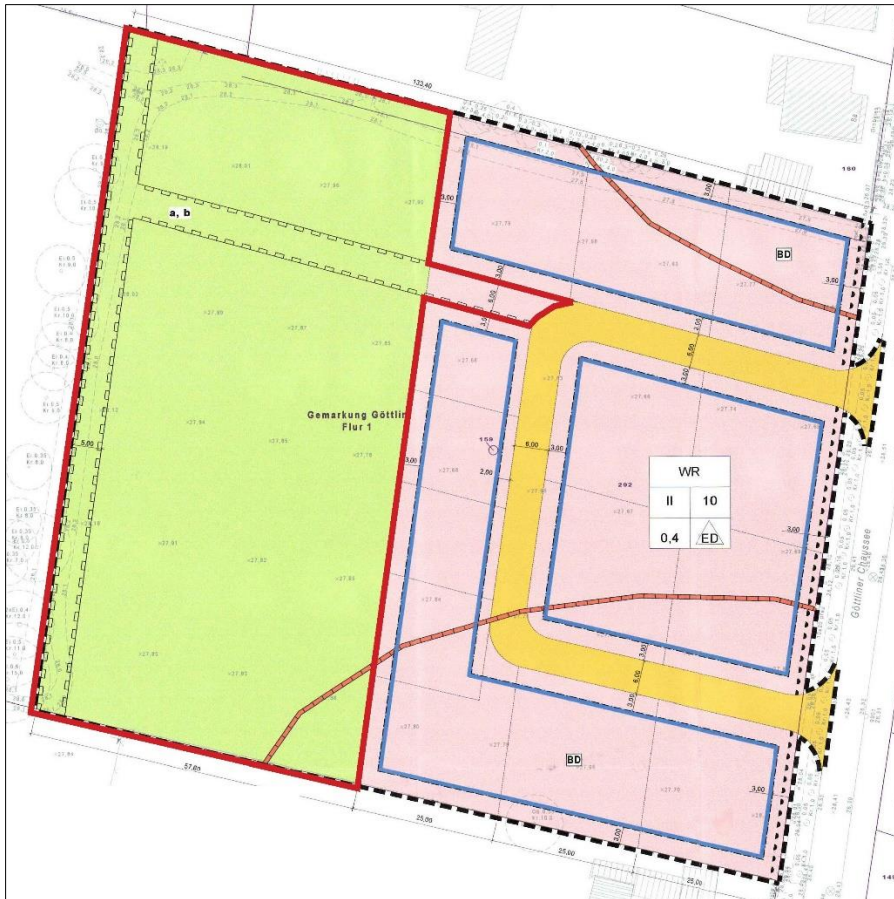
Abbildung 2: Räumlicher Geltungsbereich der 1. Änderung des B-Planes Nr. 063-1 „Wohngebiet Göttliner Chaussee“; Basis Planzeichnung rechtskräftiger B-Plan 05/2018 (ohne Maßstab)