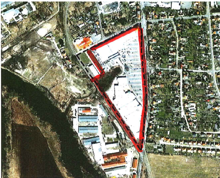
Das Plangebiet grenzt im Osten an die Milower Landstraße, im Süd-Westen an die Bahnlinie Rathenow-Brandenburg und im Norden an die Gustav-Freytag-Straße

Der Bebauungsplan kann einschließlich seiner Begründung im Bauamt der Stadtverwaltung der Stadt Rathenow, Berliner Str.15, Zimmer 419 während der üblichen Sprechzeiten oder auf www.rathenow.de eingesehen werden. Jedermann hat die Möglichkeit über den Inhalt Auskunft zu verlangen.